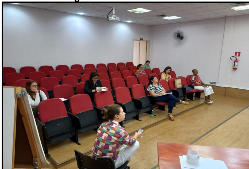
Figura 2 – Plenário do CMH.