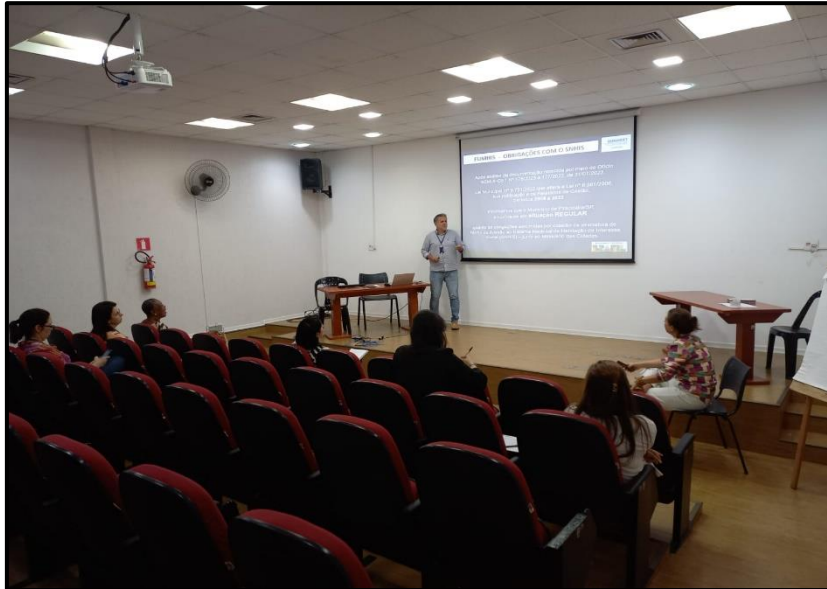
Figura 1 – Boas Vindas e Apresentação da Pauta da Reunião aos Membros do CMH.